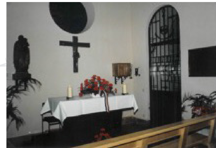
D'Scoutsresistenzlerkapell an der Grenzer Kierch zu Esch

De Scoutismus war fir déi jonk Männer eng gutt Schoul, well de Grënner a Chef Robert BADEN POWELL, si duerch seng Erziéungsmethod ganz spezifesch op d'Liewen an op hir Afferbereitschaft préparéiert hat. Esou waren si sech bewusst, wat dat gewotent „Spill“, op dat si sech agelooss hunn, mat sech bréngen kënnt. Well dee klengste Feeler konnt d'Deportatioun an e KZ, d'Émsidlungslager mat der Famill, d'Konfiskéiere vum Verméigen, laang Prisongsstrofen an esouguer d'Doudestrof mat hire brutalste Vatiante no sech zéien. „Mir waren eis am kloren iwwert d'Brutalitéit vum Nazigesetz an dach hu bis op wéineg Ausnamen ganz vill vun eise Chef, Aumônieren a Rover, vill Cheftainen an och Scouten sech do wou et drop ukoum, géint den Naziterror gestäipt...“