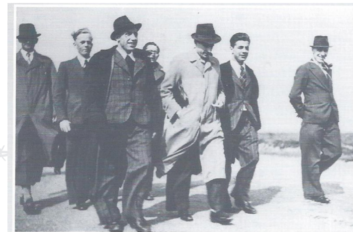
20.2.1941 Chef aus dem Süddistrikt ënnerwee an d'Kathedral