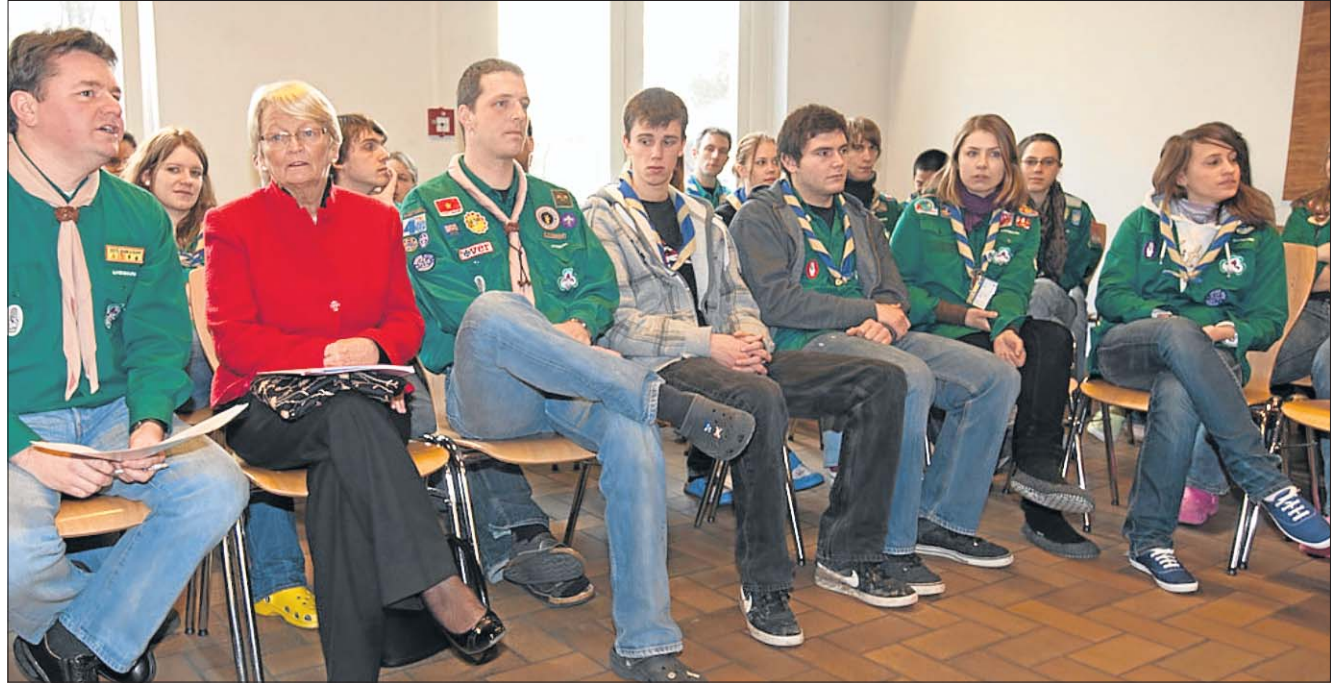
Kooperationsministerin Marie-Josée Jacobs stellte sich im LGS-Chalet in Neuhäusgen den Fragen der aufmerksamen Pfadfinder.

Die aufmerksamen Pfadfinder wollten ihrerseits Hintergrundinformationen von der Ministerin: Die Fragen zielten größtenteils auf die Auswahl der Partnerländer, die Wirksamkeit der geleisteten Hilfe sowie die Geldflüsse der Spenden ab. Ressortministerin